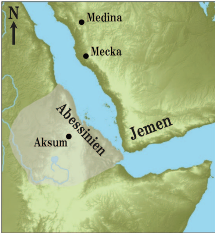
Figur 2. Regionen kring Röda havet omkring år 600. Karta: Astrid Hylén