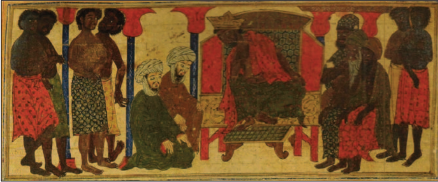
Figur 1. Negus av Abessinien och den icke-muslimska delegationen från Mecka. Illustration från Världshistoria av Rashīd al-Dīn (d. 1318). Public Domain via Wikimedia Commons, https://commons.wikimedia.org/wiki/File:Hijra_Abyssinia_(Rashid_ad-Din).jpg